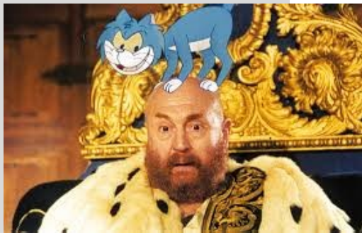
Tournage du film « Lorenz im land der Lügner » dans les années 1990, dans la salle d'honneur du Château.