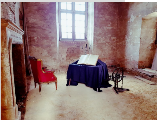
Scénographie de « la Belle au bois dormant » dans une salle non restaurée du Logis du Prieuré pour des prises de vues réalisées au printemps 2016.